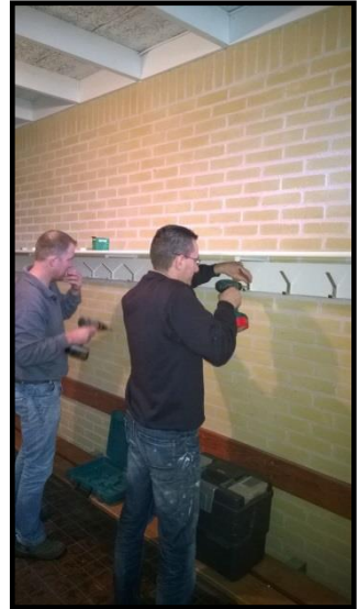
De voorzitter aan het werk.