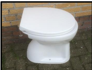
Een nostalgisch exemplaar.